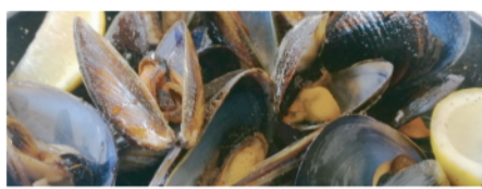
MUSCLOS A LA BRASA (Mejillones a la brasa)