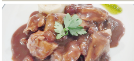
ESTOFAT DE VEDELLA AMB SALSÀ DE BOLETS (Estofado de ternera con salsa de setas)