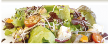
AMANIDA AMB FORMATGE, FRUITS SECS I POLLASTRE (Ensalada con queso, frutos secos y pollo)

Per cada 4 persones inclou: ENTRANTS PER COMPARTIR (Cal triar 3)