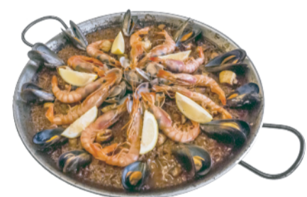
PAELLA MARINERA (Mínim 2 persones)