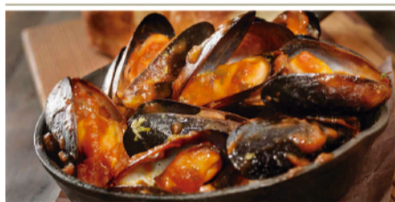
MUSCLOS A LA MARINERA (Mejillones a la marinera)