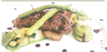
SECRET IBÈRIC (Secreto ibérico)

(Paella de gamba vermella SUPL. +3€ PERS. )